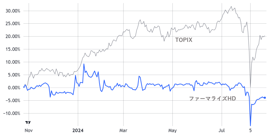
対TOPIX相対株価チャート (1年)

株価は2024/5期の一株当たり純資産である636.25円を意識した水準にいと考えられる。配当利回り(約2.3%)を考えればPBR1倍の水準は下値はある程度堅いと見ることが出来よう。しかし、25/5期は黒字化するとは言えROEは0.6%程度であり、今後の株価上昇には利益水準を切り上げることが必要であることは論を待たない。前述の自社株買いと共に前期に買収した調剤薬局チェーンの利益率向上、さらなる処方箋枚数の増加などの好材料を期待したい。